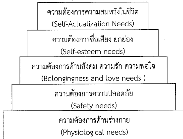
ภาพที่ ๑ ความต้องการของมนุษย์ทั้ง ๕ ชั้น ของ Maslow (ที่มา : สาวิณี แสงสุริยันตร์และคณะ, ๒๕๔๒)

๕. ความต้องการความสมหวังในชีวิต (Self-actualization needs) ความต้องการสูงสุดของมนุษย์ คือความสำเร็จในชีวิตความนึกคิดหรือความคาดหวังความทะเยอทะยาน ความใฝ่ฝัน ภายหลังจากที่มนุษย์ได้รับการตอบสนองความต้องการทั้ง ๔ ขั้น อย่างครบถ้วนแล้วความต้องการในขั้นนี้จะเกิดขึ้นและมักจะ เป็นความต้องการที่เป็นอิสระเฉพาะแต่ละคน ซึ่งต่างก็มีความนึกคิด ใฝ่ฝันอยากที่จะประสบผลสำเร็จในสิ่งที่คาดหวังไว้อย่างสูงส่งในทัศนะของตน (สาวิณี แสงสุริยันตร์ และคณะ ๒๕๔๗) ดังภาพที่ ๑